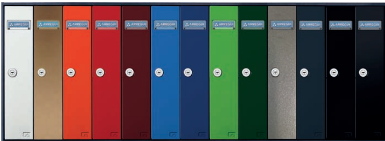
Bianco RAL 9016 Ocra RAL 1036 Arancione RAL 2004 Rosso RAL 3020 Rosso Ruggine RAL 3009 Indaco Celeste RAL 5015 Blu Violetta RAL 5000 Verde Mela RAL 6018 Verde Bosco RAL 6005 Grigio RAL 9006 Grigio Antracite RAL 7016 Nero Opaco RAL 9005M Nero Lucido RAL 9005B